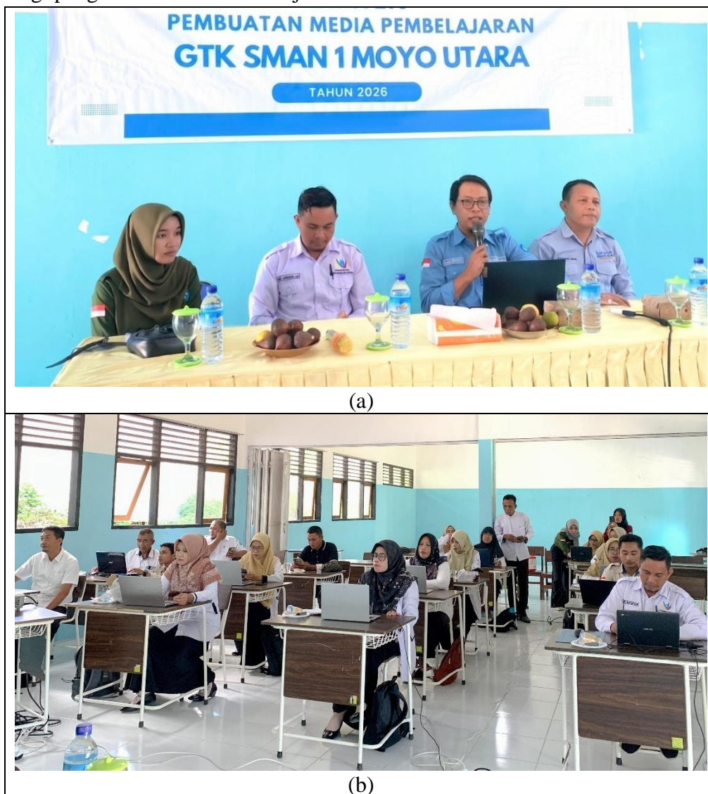
Gambar 2. Dokumentasi kegiatan workshop: (a) Sesi konseptual dan diskusi etika AI dan hands-on prompt engineering; (b) Sesi aplikasi pembuatan draft artikel, refleksi, dan tindak lanjut

Dokumentasi visual kegiatan workshop menunjukkan keterlibatan aktif peserta selama empat sesi berlangsung. Peserta terlihat antusias dalam melakukan praktik langsung menggunakan platform Perplexity AI pada perangkat masing-masing, serta aktif berdiskusi dan saling berbagi pengalaman antar rekan sejawat.