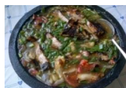
2. Sepat Biasa