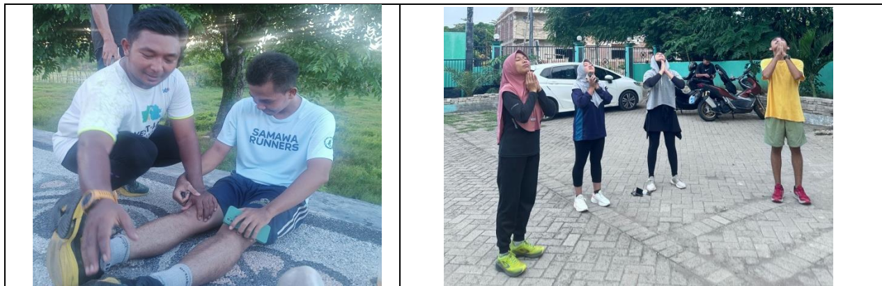
Gambar 2. Kegiatan diskusi dengan pelari

pelari. Cross training membuat otot yang biasanya tidak terlalu terlatih saat lari, menjadi lebih terlatih dan mencegah terjadinya cedera karena ada ketidakseimbangan pada otot.