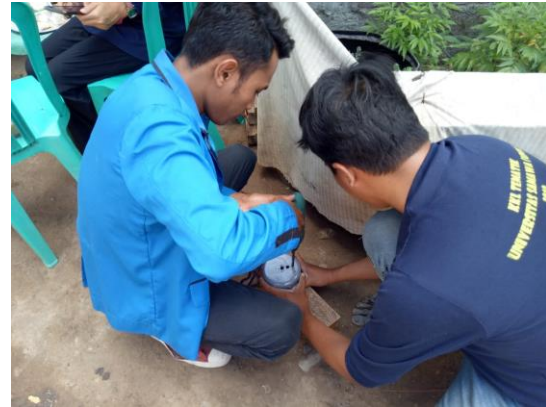
Gambar 2. Proses Pembuatan Biopori

Pelaksanaan kegiatan pengabdian masyarakat pemanfaatan biopori untuk menjawab salah satu masalah yang dihadapi oleh masyarakat Desa Lape, khususnya Dusun Lape Atas ini diawali dengan sosialisasi mengenai pentingnya pembuatan lubang resapan biopori, cara membuat lubang biopori dan penentuan titik strategis lubang biopori. Hasil sosialisasi tersebut terutama tokoh di lingkungan Dusun Lape Atas bersedia untuk mengadopsi teknologi biopori untuk mengurangi pencemaran air limbah rumah tangga, melalui biopori memanfaatkan sampah organik rumah tangga menjadi kompos. Kegiatan sosialisasi ini dilakukan di ruang pertemuan Desa Lape dan dihadiri oleh seluruh pengurus RW dan RT serta beberapa warga.